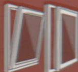
Tilt And Turn Windows