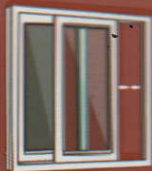
Sliding Windows And Doors